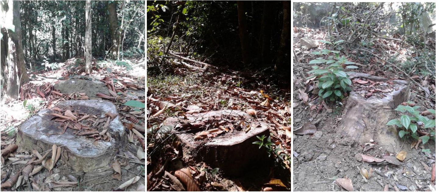
( මෑතකදී උඩකිරුව වැසි වනාන්තරයේ කපා විකුණා ඇති හොර ගස් )

ඉහත කරුණු හේතුකොටගෙන පරිසර අමාත්‍යාංශය හා මධ්‍යම පරිසර අධිකාරිය එකතුවී හොර ( Dipterocarpus zeylanicus ) ශාඛය ආරක්ෂිත ශාඛයක් ලෙස කඩිනමින් නීති ගත නොකලහොත් එය සඳහටම ශ්‍රී ලංකාවට හා ලෝකයට අහිමි වී යන දිනය වැඩි ඇතක නොවන බව තේරුම් ගත යුතුය. මෙම නීති ගත කිරීමට පසුව අදාළ ප්‍රදේශවල ග්‍රාම නිලධාරී, දිස්ත්‍රික් ලේකම්, ප්‍රාදේශීය ලේකම් හා වන සංරක්ෂණ දෙපාර්තමේන්තු නිලධාරීන් වහා දැනුවත් කිරීමක් කල යුතුය. මේ පිලිබඳව පරිසර අමාත්‍යාංශය හා මධ්‍යම පරිසර අධිකාරිය එකතුවී වහාම පියවර ගන්නා ලෙස අප කාරුණිකව ඉල්ලා සිටිමු.